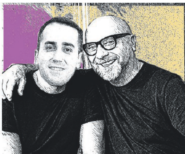
VOLTA & GABBANA